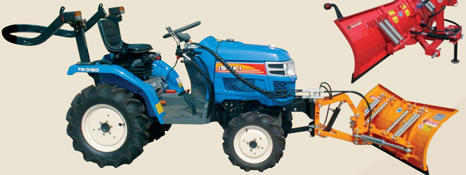
Lama sgombraneve LSN